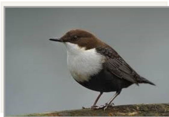
Strömstaren, vår maskot?