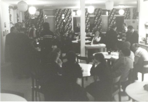
Stormöte i Viks Skola vid bildandet, 24 mars 1980