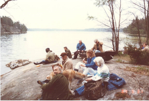
Gökotta vid Skolviken, Våmfjärden, maj 1984